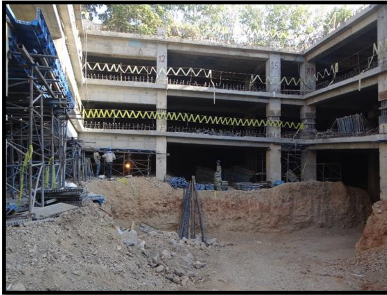
نمای کلی کارگاه