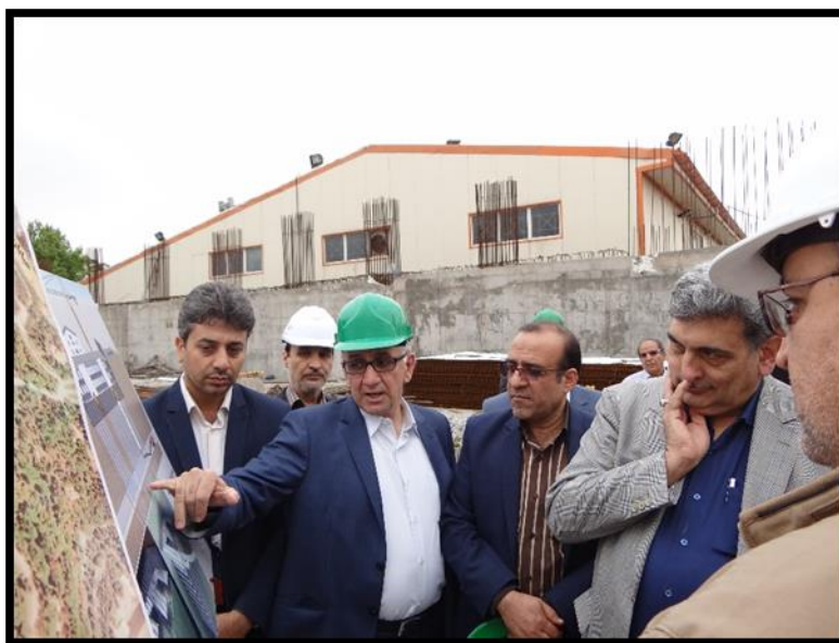
بازدید اعضای محترم شورای شهر و شهرداری تهران از پروژه