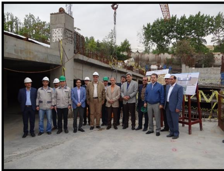
بازدید اعضای محترم شورای شهر و شهرداری تهران از پروژه

كارفرما: سازمان مهندسي و عمران شهر تهران