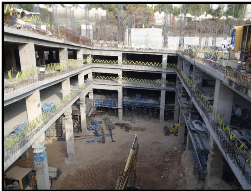
نمای کلی کارگاه