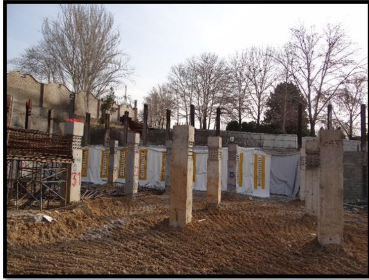
عایق بندی دیواره شرقی کارگاه