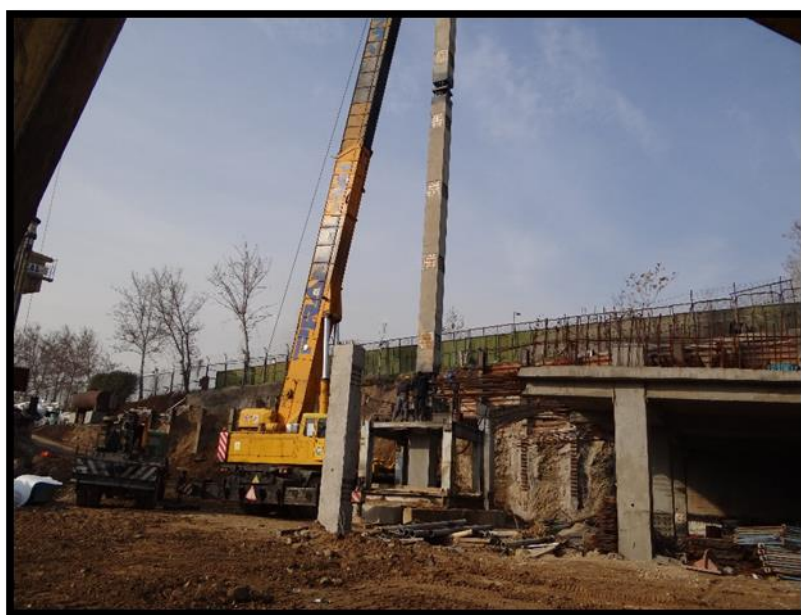
نصب ستون میانی