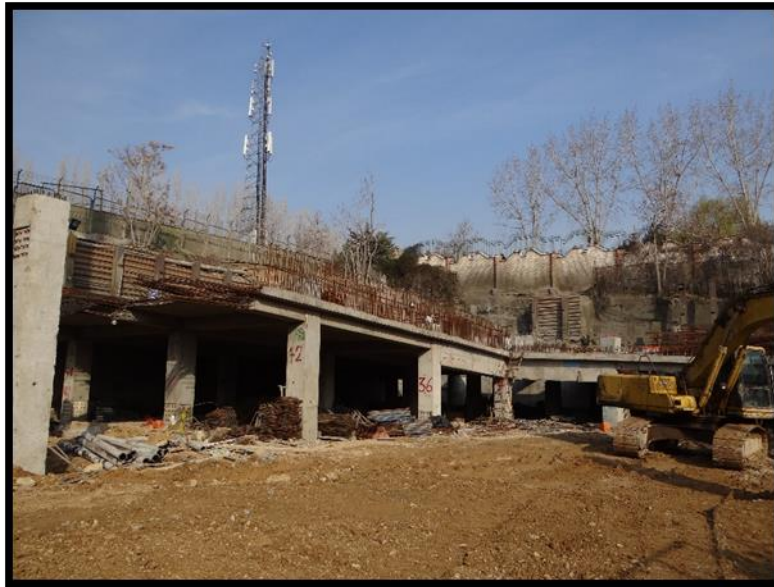
سقف بتن ریزی شده طبقه اول